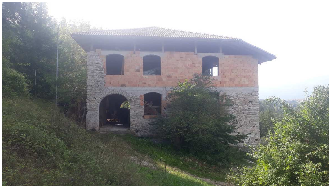
Vista da nord