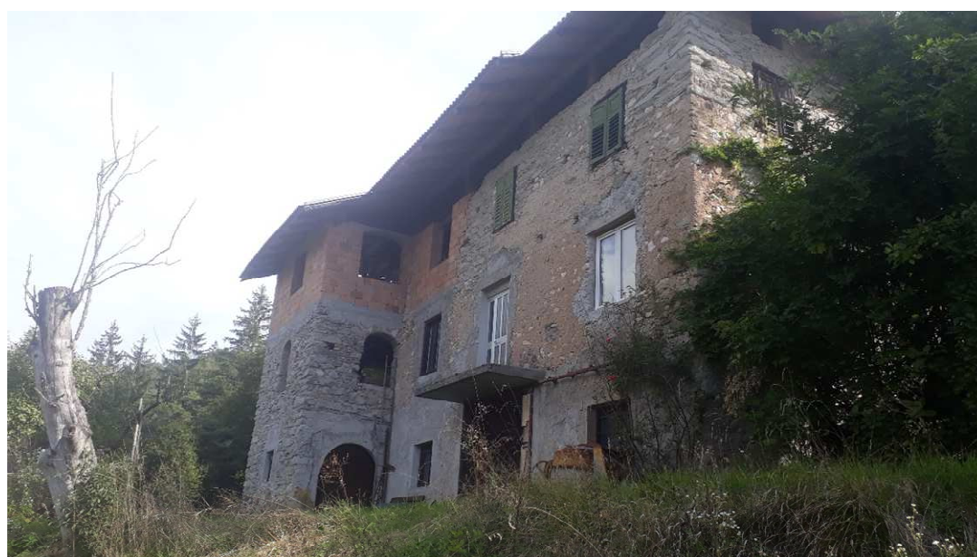
Vista da ovest